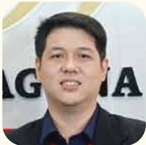
Direktur Keuangan Derry, B.A

“Hendaklah keadilan ditegakkan agar langit tidak runtuh”