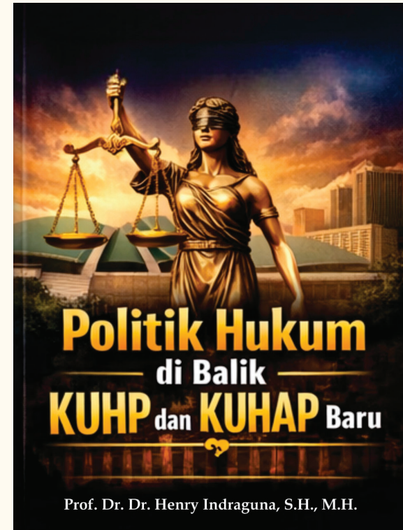
Politik Hukum di Balik KUHP dan KUHP Baru