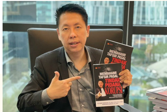
Memahami Tafsir Pasal Tindak Pidana Korupsi, Kaidah Hukum Dan Doktrin-doktrin Dalam Tindak Pidana Korupsi